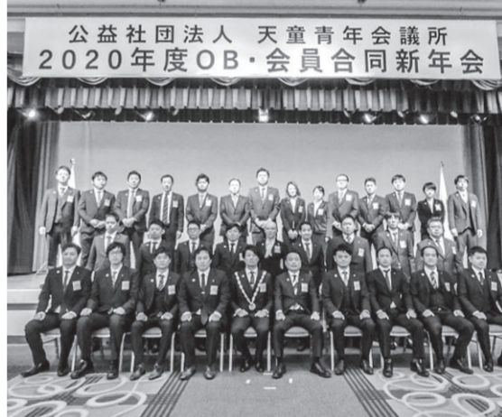
▲2020年度OB・会員合同新年会

力があつたからです。これまで、協力をいただいたすべての皆様にご感謝を伝えるとともに、天童が50年、10年後も活気あふれる持続可能なまちであるように、地域に必要とされる活動を行っていくことに、メンバーの資質向上に努めてまいります。 2020年度は、将棋と気軽に触れ合うことができる機会を提供する事業の開催や、市民の皆様が希望と夢をお届けする事業を行う予定です。私たちが